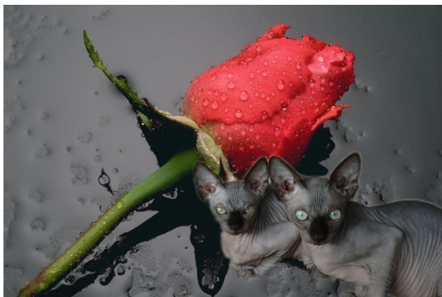
Ingestuurd door Louise Boersma van cattery Kucing-telanjang

Heb je een leuke foto van een show, een leuke foto van je kat met tulp (of een andere bloem) .....stuur hem naar ons op!